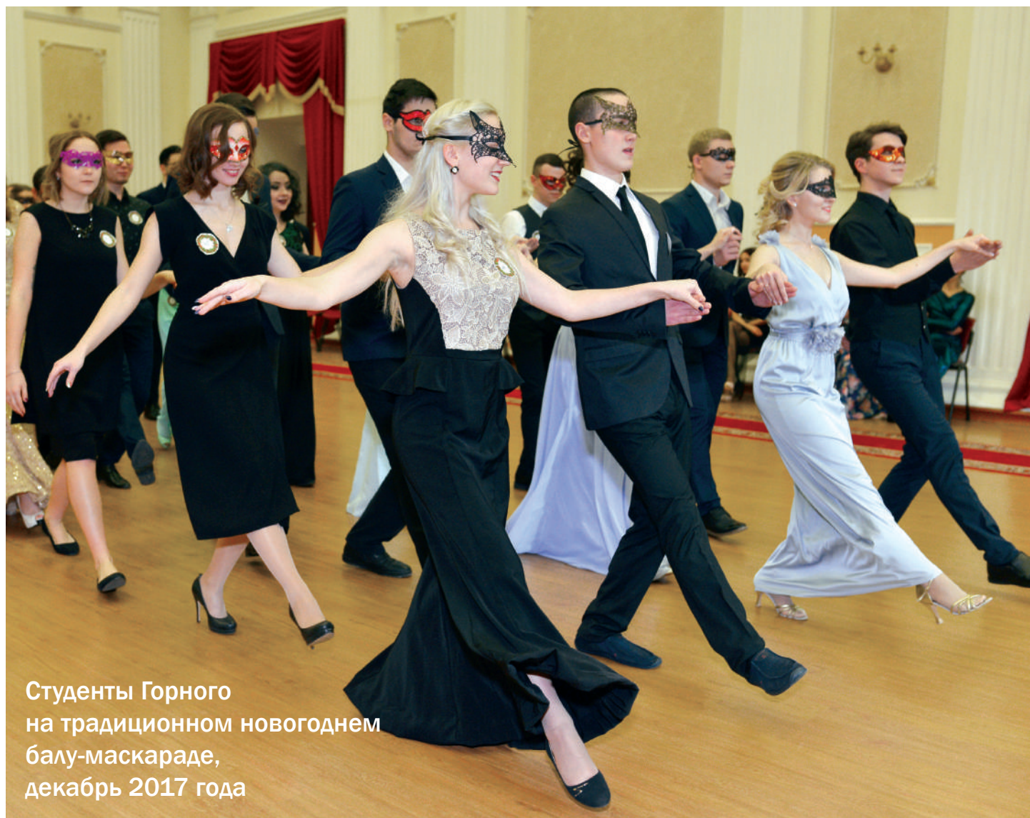
Студенты Горного на традиционном новогоднем балу-маскараде, декабрь 2017 года