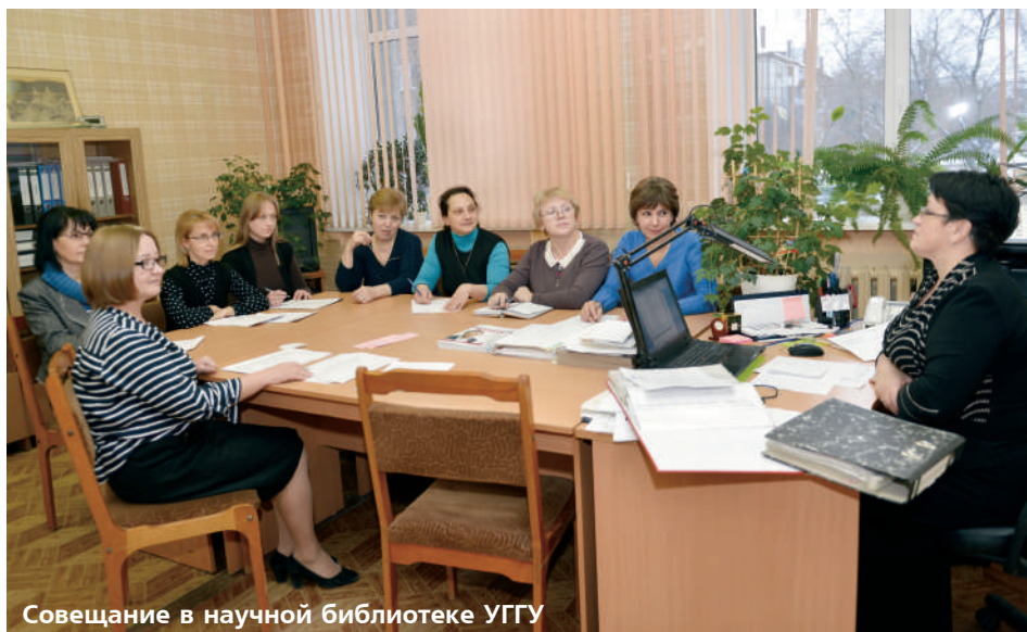
Совещание в научной библиотеке УГГУ