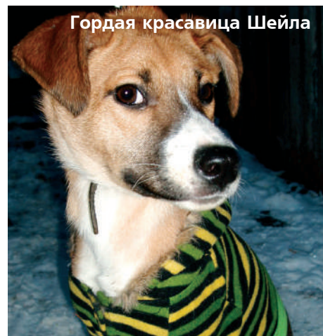
Гордая красавица Шейла

Нежная, хрупкая, беззащитная, легко ранимая Лора украсит жизнь тому человеку, кто жаждет о ком-то заботиться, кого-то лелеять и холить. Лора позволит вам реализовать нерастратченную любовь и нежность, в благодарность вы получите тот «хвостик», который будет тихонечко следовать за вами повсюду, улавливая ваше настроение и всецело разделяя его.